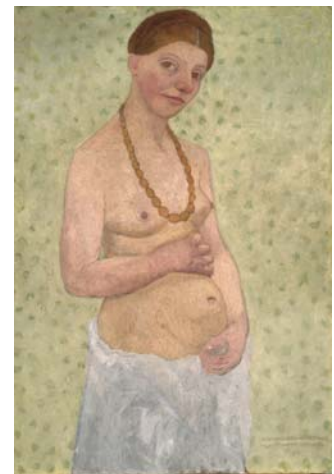
Visuel :Paula Modersohn-Becker, Autoportrait au sixième anniversaire de mariage, 1906, détrempe sur carton, 101,8 x 70,2 cm, Museen Böttcherstrasse, Paula Modersohn-Becker Museum, Brême

« Car à cela tu t'entendais : les fruits dans leur plénitude. Tu les pesais sur des coupes devant toi, Tu en évaluais le poids par les couleurs. Et comme des fruits aussi tu regardais les femmes Et les enfants de même, modelés par une poussée intérieure Jusqu'aux formes de leur existence. Et pour finir, toi-même tu te vis comme un fruit, Tu te dépouillas de tes vêtements, tu allas te placer Devant le miroir et tu t'y enfonças Jusqu'à y perdre ton regard : lequel, gardant courage, S'abstint de dire : c'est moi. Non : ceci est ». Rainer Maria Rilke, Requiem pour une amie