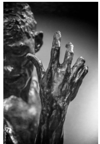
Main de Pierre Wissant, détail des 'Bourgeois de Calais', Rodin, bronze 1895

Entrée 10 € - 8 € pour les adhérents / Étudiants : 8 € - 6 € pour les adhérents Gratuit pour les enfants / Réservation conseillée