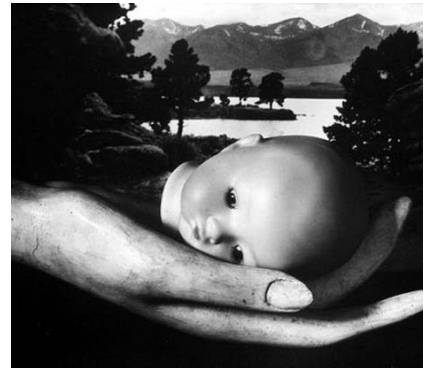
visuel Ruth Bernhard Creation 1936

" Un enfant, avec un peu de chance, ça entend le silence et ça pleure des diamants" Jacques Brel