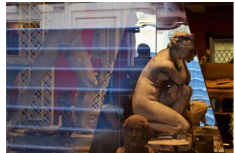
visuel Sylvie Teissier

Le samedi 16 juin, à l'occasion du BLOOMSDAY, lecture-performance à la Galerie Depardieu : de 14h30 à 19h, Paul LAURENT lira des extraits de ULYSSE de James JOYCE. N'hésitez pas à venir passer quelques moments à la rencontre de ce monument de la littérature. En plus de 1000 pages, il relate la journée du 16 juin 1904 à Dublin à travers les pérégrinations physiques et mentales de trois personnages principaux : Léopold Bloom, Stephen Dedalus et Molly Bloom.