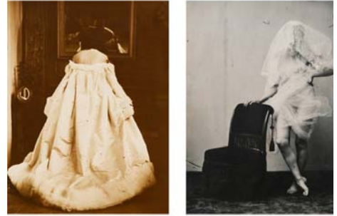
visuel Pierre-Louis Pierson

Pendant des années, j'avais pensé que la moindre des choses, pour écrire, c'était de tenir son sujet. Je ne savais pas que le sujet, c'est justement lui qui vous tient. Je ne savais pas non plus qu'il peut ne tenir à rien, note Nathalie Léger, aux premières pages de L'Exposition. S'impose alors à elle, comme une obsession, comme une dévotion, cet étrange motif : la comtesse de Castiglione (1837-1899), figure énigmatique du Paris du second Empire, courtisane d'origine italienne qui, outre qu'elle fut la maîtresse de Napoléon III et, disait-on, « la plus belle femme du XIXème siècle », prit l'initiative de se faire photographier pendant plus de quarante ans, plusieurs fois par semaine parfois, dans les studios du photographe-portraitiste Pierre-Louis Pierson. Nathalie Crom, Télérama, 22 nov 2008