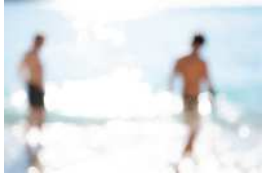
Série Vague Nitescence, 105 x 70 cm