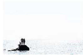
Série Vague Nitescence, 105 x 70 cm