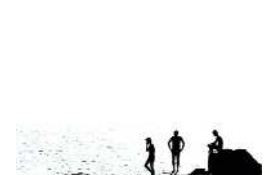
Série Vague Nitescence, 60 x 90 cm