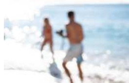
Série Vague Nitescence, 60 x 90 cm