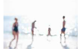
Série Vague Nitescence, 40 x 60 cm