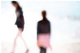
Série Vague Nitescence, 60 x 90 cm