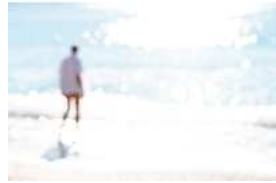
Série Vague Nitescence, 60 x 90 cm