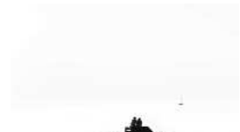
Série Vague Nitescence, 60 x 90 cm