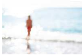
Série Vague Nitescence, 60 x 90 cm