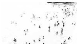
Série Vague Nitescence, 60 x 90 cm