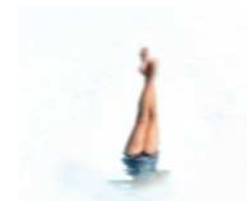
Série Vague Nitescence, 40 x 60 cm