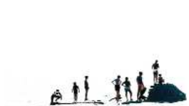
Série Vague Nitescence, 60 x 90 cm