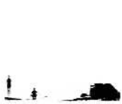
Série Vague Nitescence, 60 x 90 cm