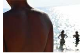
Série Vague Nitescence, 60 x 90 cm