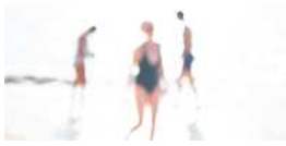
Série Vague Nitescence, 60 x 90 cm