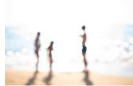
Série Vague Nitescence, 60 x 90 cm