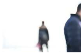
Série Vague Nitescence, 60 x 90 cm