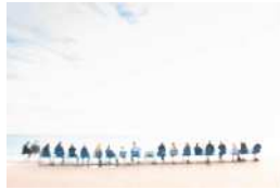
Série Vague Nitescence, 60 x 90 cm