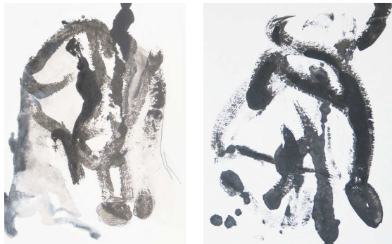
Série Jeter l'encre, 29,7 x 42 cm, encre de chine