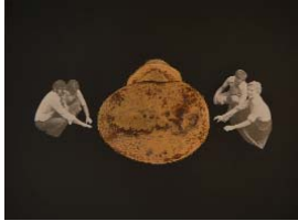
LES EXPLORATEURS o. (La série 1) 2018, 40x29,7cm, collage