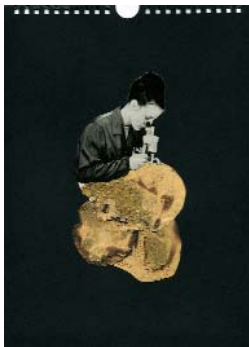
LES EXPLORATEURS f. (La série 1) 2018, 21x29cm, collage