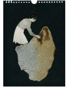
LES EXPLORATEURS d. (La série 1) 2018, 21x29cm, collage