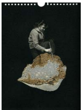
LES EXPLORATEURS j. (La série 1) 2018, 21x29cm, collage