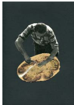
LES EXPLORATEURS l. (La série 1) 2018, 21x29,7cm, collage