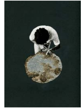
LES EXPLORATEURS m. (La série 1) 2018, 21x29,7cm, collage