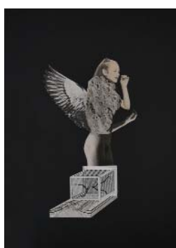
FRIVOLE, 2018, 40x29,5cm, collage