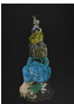
L'ASCENSION, 2018, 50x70cm, collage