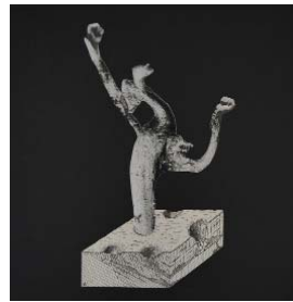
LE BOIS FLOTTÉ, 2018, 26,5x26,5cm, collage