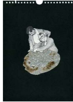
LES EXPLORATEURS c. (La série 1) 2018, 21x29cm, collage