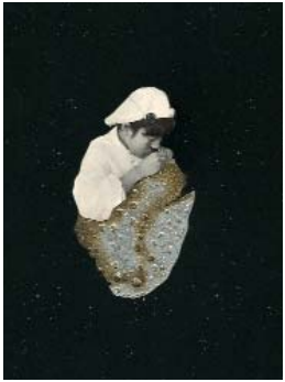
LES EXPLORATEURS a. (La série 1) 2018, 21x24,5cm, collage