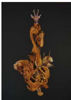
LA FUSION SECRÈTE, 2018, 42x59 cm, collage