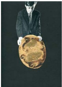
LES EXPLORATEURS k. (La série 1) 2018, 21x29,7cm, collage