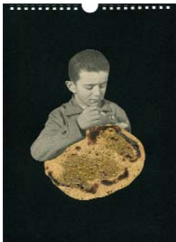
LES EXPLORATEURS e. (La série 1) 2018, 21x29cm, collage