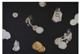
LES EXPLORATEURS n. (La série 1) 2018, 35x49,8cm, collage