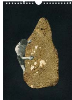
LES EXPLORATEURS h. (La série 1) 2018, 21x29cm, collage