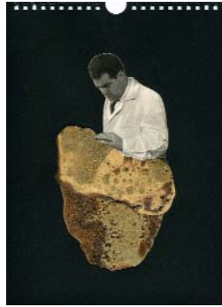
LES EXPLORATEURS b. (La série 1) 2018, 21x29cm, collage