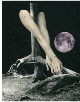
LE BASSIN, 2018, 18x22cm, collage