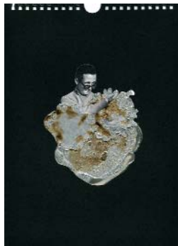
LES EXPLORATEURS g. (La série 1) 2018, 21x29cm, collage