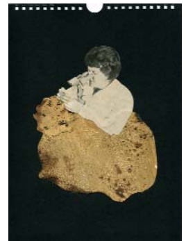
LES EXPLORATEURS i. (La série 1) 2018, 21x29cm, collage