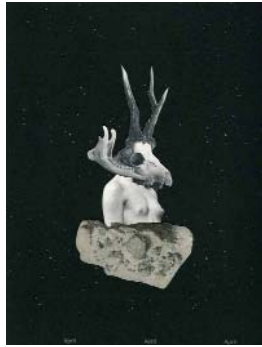
POUR L'ÉTERNITÉ, 2018, 18x23 cm, collage