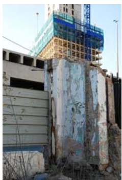
Fragment n°3 - Marseille, 2017 pho- tographie numérique 70 x 50 cm