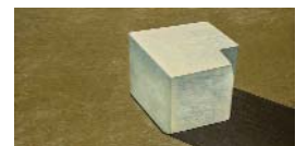
Sculpture - 2014 huile et laque sur toile marouflée sur bois 120 x 210 cm