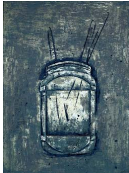
Récipient - 2005 lithographie (tirage en 110 exemplaires) 72, 5 x 54, 5 cm, collection particulière Albi, collection Télérama, Paris