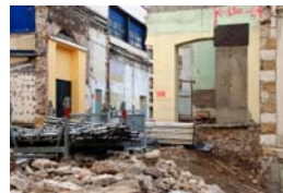
Fragment - Marseille, 2017 photographie numérique 50 x 70 cm