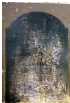
Passage - 2002 huile et laque sur toile 140 x 105 cm