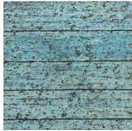
Palissade n°15 - 2015, huile, laque et bois sur toile 40 x 40 cm