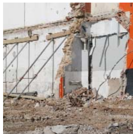
Fragment n°7 - Marseille, 2017 photographie numérique 50 x 50 cm