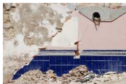
Fragment n°8 - Marseille, 2017 pho- tographie numérique 50 x 70 cm