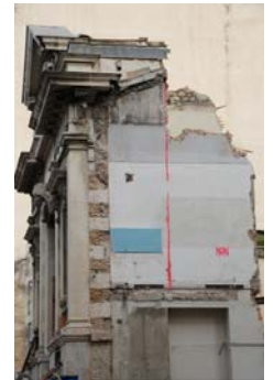
Fragment n°2 - Marseille, 2017 pho- tographie numérique 70 x 50 cm