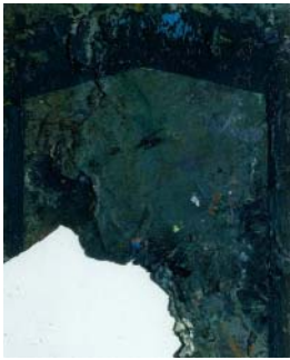
Passage - 2005 huile et laque sur radiographie 30 x 24 cm