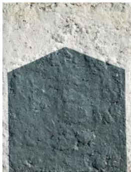
Passage - 2019 huile et laque sur toile 35 x 27 cm