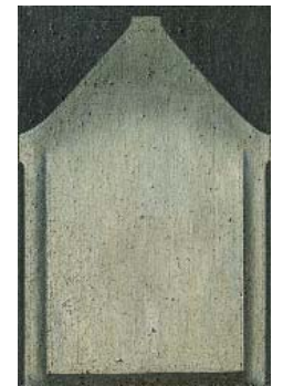
Entropie n°3 - 2018 huile et poussière sur toile, 152 x 101 cm