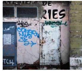
Fragment - Marseille 2017 Photographies numériques, 70 x 50 cm