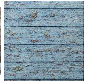
Palissade n°26 - 2015 huile, laque et bois sur toile 40 x 40 cm