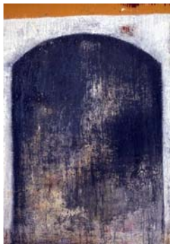
Passage - 2002 huile et laque sur toile 140 x 105 cm