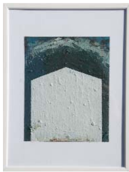
Variation indicible - 2019 huile sur carton 12,5 x 10,5 cm 1/ 40 (40 pièces)