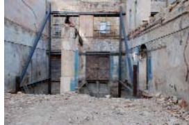
Fragment n° 4 - Marseille, 2017 photo- graphie numérique 50 x 70 cm