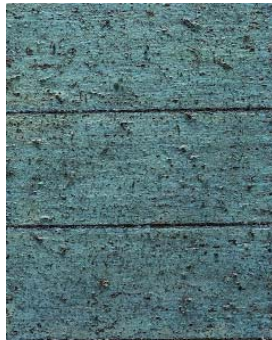
Palissade - 2016 huile et poussière sur toile 34 x 20 cm