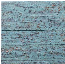
Palissades - 2015 huile, laque et bois sur toile 40 x 40 cm