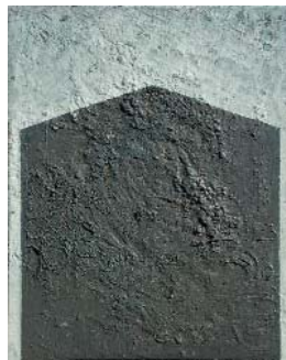
Passage - 2019, huile et laque sur toile 40 x 30 cm