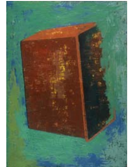
Récipient - 2006, huile et laque sur toile 150 x 110 cm