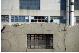
Fragment n°5 - Marseille, 2017 photographie numérique 50 x 70 cm