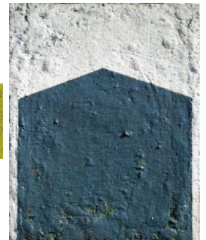
Passage - 2019 huile et laque sur toile 30 x 24 cm