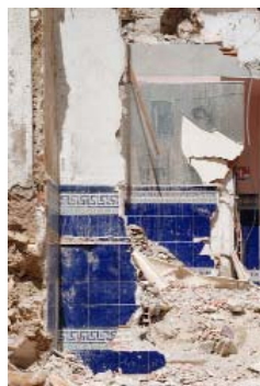
Fragment n°6 - Marseille, 2017 photographie numé- rique 70 x 50 cm