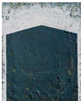
Passage - 2019 huile et laque sur toile 40 x 30 cm