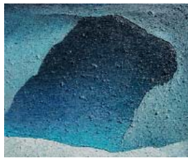
Le gouffre - 2019 huile sur toile 54 x 65 cm