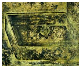
Récipient - 2007 huile et laque sur linoléum 34,9 x 43,8 cm