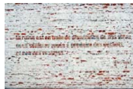
Fragment - Tourcoing, 2017 pho- tographie numérique 50 x 70 cm