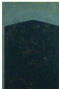
Passage - 2006 huile, laque et pigment sur toile 140 x 105 cm