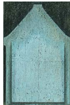
Entropie - 2018 huile et poussière sur toile, 152 x 101 cm