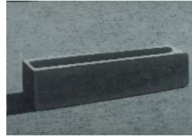
Sculpture n°10 - 2009, huile et laque sur toile 160 x 200 cm