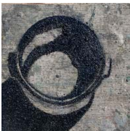
L'atelier - 2019, huile sur toile marouflée sur bois 20 x 20 cm