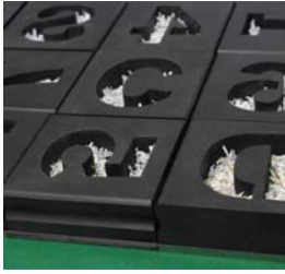
CONVERS(AT)ION, Wood, felt, shreds of dictionaries pages, paint (about) h 800 w 1800 d 1800mm 2018