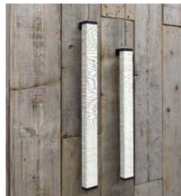
COMPRESSION, (5 pieces : #2-3-5-6-7) Japanese dictionarie, rubber, metal (each) h 1003mm w d variable, 2017