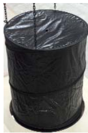
ABÎME, (3 pieces: #1-2-3) Garden bags, shreds of dictionaries pages, chain, mirror (each:about) h 680 w 565 d 565mm 2018