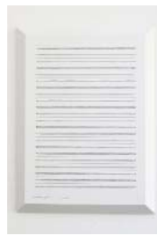
HB COULÉE SILENCIEUSE, noir.rouge.vert.bleu.H B, Paper on wood, ball pen/pencil, glue (each) h 337 w 250 d 23mm, 2018