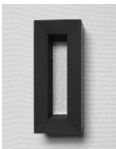
OUVERTURE #2, French dictionary, wood, ink h 180 w 260 d 110mm, 2010