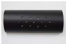
PAUSARE, (9 pieces) Bamboo, shreds of dictionaries pages, paint (about) h 120 w 300 d 60mm 2018