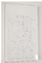
Aa, French dictionary, plaster board, ink, wood, h 515 w 310 d 30mm, 2012