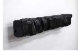
MOLÉCULES , (3 pieces: 5~F / 3~4 / E~8) Wood, self bonding tape (Each: about) h 80 w 535 d 70mm, 2018