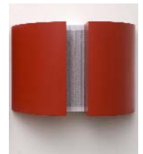
INVERSUM-IN, French dictionary, wood, ink h 180 w 260 d 110mm, 2010