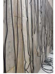
SUSPENSUS, Rubber (about) h 1700 w 3200 d 100mm 2016