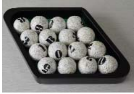
ATTENTE, (3 pieces: a/b/c) Wood, felt, shreds of dictionaries pages, paint (each) h 50 w 310 d 210mm, 2018