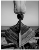
Kilberg, Vardø, Norway, 1990