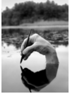
Fosters Pond, 2000