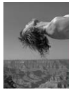
Grand Canyon, 1995