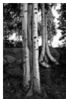
Väisälänsaari, Finland, 1998