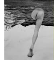
Jamestown, Rhode Island, 1974