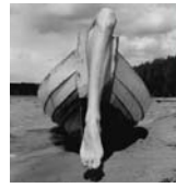
Kuusamo, Finland, 1976