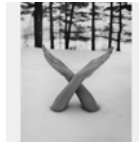
Fosters Pond, 1996