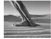
White Sands, New Mexico, 2000