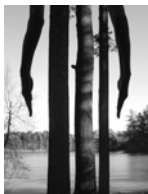
Three-Legged Crow, Fosters Pond, 2016