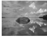
Oulujärvi Afternoon, Paltaniemi, Kajaani, Finland. 2009