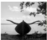
Väisälänsaari, Finland, 2008