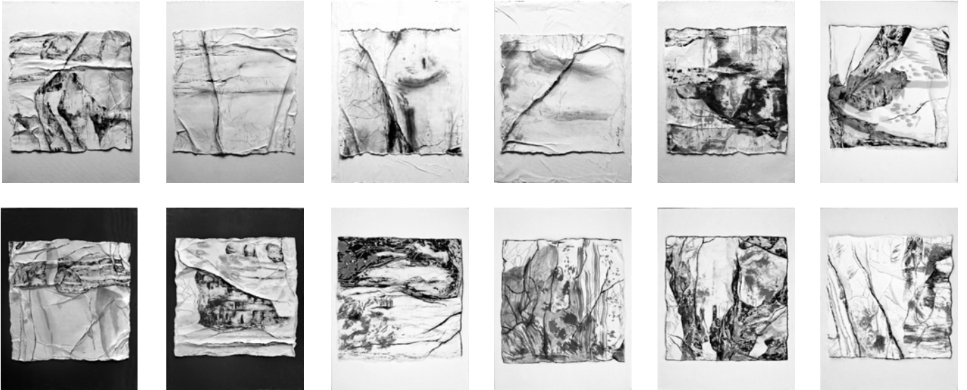
Fluides, 27 x 27 cm, marouflés sur toile 30 x 40 cm encre de Chine et acrylique sur papier coréen