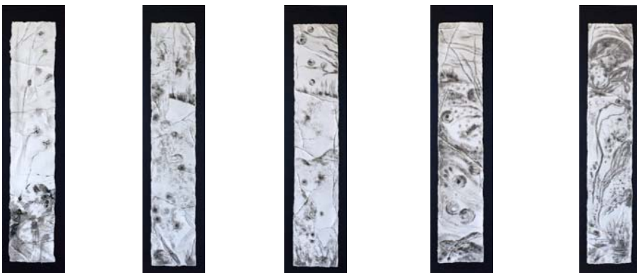
Fluides, 27 x 143 cm, sur cadres peints 38 x 166 cm, encre de Chine et acrylique sur papier coréen