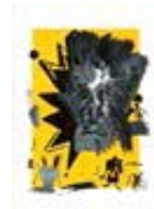
111565 Papier, 2017, Série : Yellow Papers Jaune, Mixte sur papier, 106 x 76 cm, encadré 119 x 89 cm