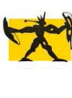
111546 Papier, 2017, Série : Yellow Papers Jaune, Mixte sur papier, 76 x 106 cm, encadré 89 x 119 cm