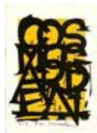
111538 Papier, 2017, Série : Yellow Papers Jaune, Mixte sur papier, 106 x 76 cm, encadré 119 x 89 cm