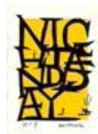
111554 Papier, 2017, Série : Yellow Papers Jaune, Mixte sur papier, 106 x 76 cm, encadré 119 x 89 cm