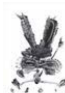
111369 Tableau, 2015, Série : Rabbit, Noir, Arylique sur toile, 92 x 73 cm,