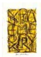
111578 Papier, 2017, Série : Yellow Papers Jaune, Mixte sur papier, 106 x 76 cm, encadré 119 x 89 cm