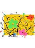
111559 Papier, 2017, Série : Yellow Papers Jaune, Mixte sur papier, 76 x 106 cm, encadré 89 x 119 cm