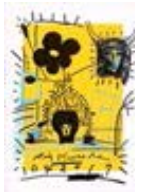
111575 Papier, 2017, Série : Yellow Papers Jaune, Mixte sur papier, 106 x 76 cm, encadré 119 x 89 cm