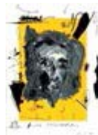
111579 Papier, 2017, Série : Yellow Papers Jaune, Mixte sur papier, 106 x 76 cm, encadré 119 x 89 cm