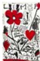
Sans titre 111196 Tableau, 2008, Série : Fleur Ana, Rouge, Huile sur toile, 100 x 65 cm,