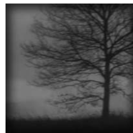
Série Entends tu 12 x 12 cm, papier Fine Art, 5 tirages, sur dibond, encadrés, 2016