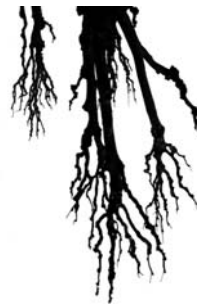
Série Couleurs 35 x 50 cm, papier Fine Art, 3 tirages, sur dibond, 2016