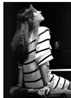
Eliane Elias 1986 Tirage numérique 1/8 sur Dibbond, 40x28,5 cm