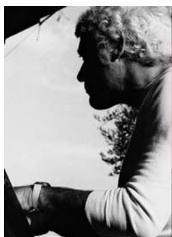
Lou Lévy 1981 Tirage numérique 1/8 sur Dibbond, 40x28,5 cm