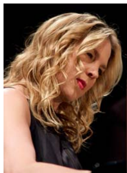
Diana Krall III 2009 Tirage numérique 1/8 sur Dibbond, 40x28,5 cm