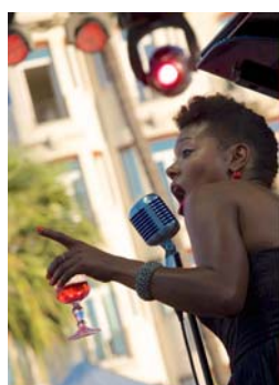
China Moses 2012 Tirage numérique 1/8 sur Dibbond, 70x50 cm