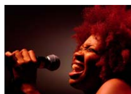
N'Dambi 2004 Tirage numérique 1/8 sur Dibbond, 50x70 cm