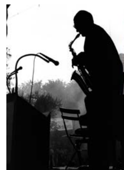
Art Pepper 1980 Tirage numérique 1/8 sur Dibbond, 70x50 cm