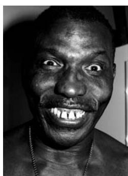
Elvin Jones 1986 Tirage numérique 1/8 sur Dibbond, 70x50 cm