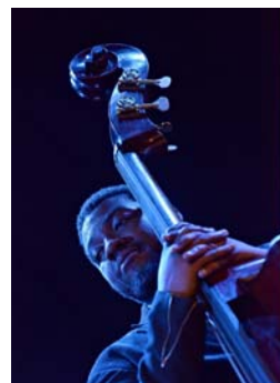
Gerald Cannon (Ravi Coltrane New Quartet) 2012, Tirage numérique 1/8 sur Dibbond, 40x28,5 cm