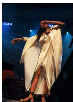
Dee Dee Bridgewater 2007 Tirage numérique 1/8 sur Dibbond, 70x50 cm