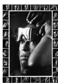
Miles Davis 1986 Tirage numérique 1/8 sur Dibbond, 110x80 cm