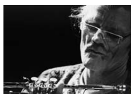
Chet Baker 1981 Tirage numérique 1/8 sur Dibbond, 50x70 cm