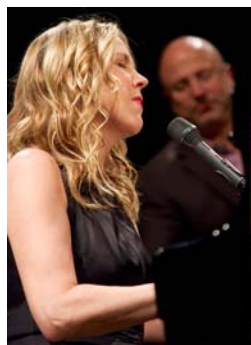
Diana Krall II 2009 Tirage numérique 1/8 sur Dibbond, 40x28,5 cm