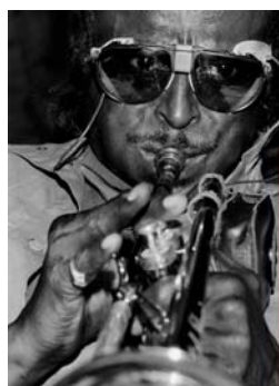
Miles Davis 1985 Tirage numérique 1/8 sur Dibbond, 40x28,5 cm