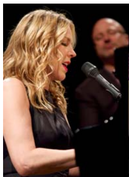
Diana Krall I 2009 Tirage numérique 1/8 sur Dibbond, 40x28,5 cm