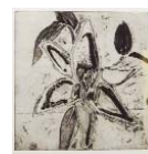
Sans titre 40 x 40 cm, eau forte sur papier arches, 2006, Édition numérotée et signée, 28 exemplaires