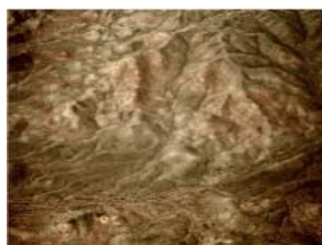
HAMIN AST 140 x 110 cm, 2009 Édition numérotée et signée, 10 exemplaires