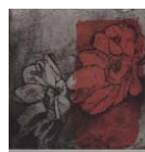
Sans titre 40 x 40 cm, eau forte sur papier arches, 2006, Édition numérotée et signée, 28 exemplaires