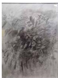
"So very many soft rustling stories to tell" 68 x 90 cm, fusain sur papier, 2012