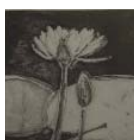
Les Fleurs qui m'ont fait du Bien 40 x 40 cm, eau forte sur papier arches, 2006, Édition numérotée et signée, 46 exemplaires