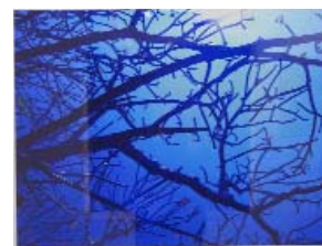
NOOR 110 x 88 cm, 2009 Édition numérotée et signée, 10 exemplaires