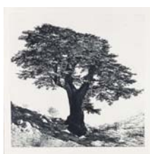
Cèdre 110 x 112 cm, eau forte, 2009, Édition numérotée et signée, 30 exemplaires