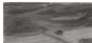
Memory-Scape 35 x 76 cm, fusain sur papier, 2011