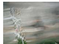
Idomeni 1 technique mixte sur toile 20x30cm