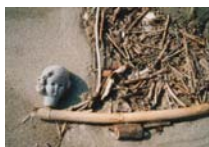
Spina 4 photographie sur toile, 20x30cm