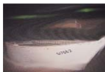
Odyssee 18 technique mixte sur toile 20x30cm