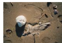
Spina 2 photographie sur toile, 20x30cm