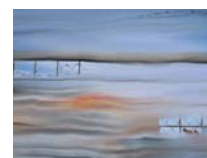
Idomeni 5 technique mixte sur toile, 20x30cm