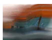
Odyssee 9. technique mixte sur toile, 20x30cm