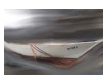
Odyssee 2 technique mixte sur toile, 20x30cm