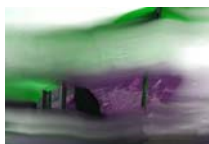
Odyssee 16 technique mixte sur toile, 40x60cm