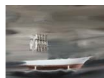
Odyssee 3 technique mixte sur toile, 20x30cm