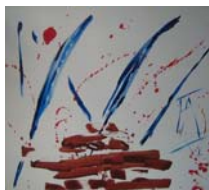
Musique pour l'Odyssee 3 acrylique sur toile, 80x100cm