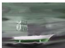
Odyssee 6 technique mixte sur toile 20x30cm