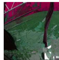
Syrakus 13 technique mixte sur toile, 20x20cm