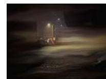
Idomeni 3 technique mixte sur toile, 20x30cm