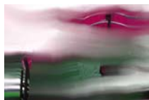
Odyssee 7 technique mixte sur toile, 40x60cm