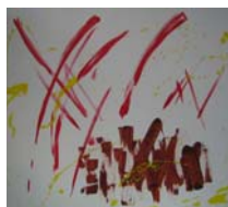
Musique pour l'Odyssee 2 acrylique sur toile, 80x100cm