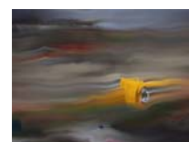
Idomeni 7 technique mixte sur toile, 20x30cm