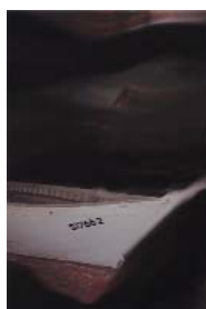
Odyssee 17 technique mixte sur toile, 30x20cm