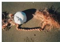
Spina 1 photographie sur toile, 20x30cm