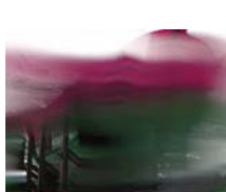
Odyssee 19. technique mixte sur toile, 20x30cm