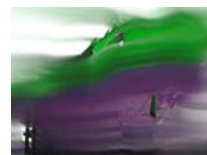
Odyssee 23 technique mixte sur toile, 20x30cm