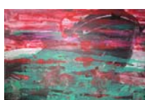
Syrakus 4 technique mixte sur toile, 80x120cm