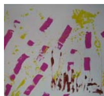
Musique pour l'Odyssee 4 acrylique sur toile, 80x100cm