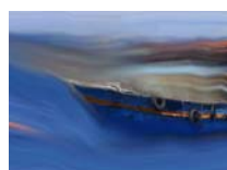
Odyssee 5 technique mixte sur toile, 20x30cm