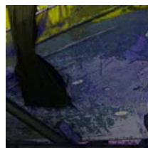
Syrakus 21 technique mixte sur toile, 20x20cm