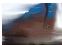
Odyssee 14 technique mixte sur toile 20x30cm