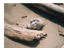
Spina 5 photographie sur toile, 20x30cm