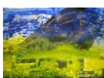
Syrakus 3 technique mixte sur toile, 80x120cm